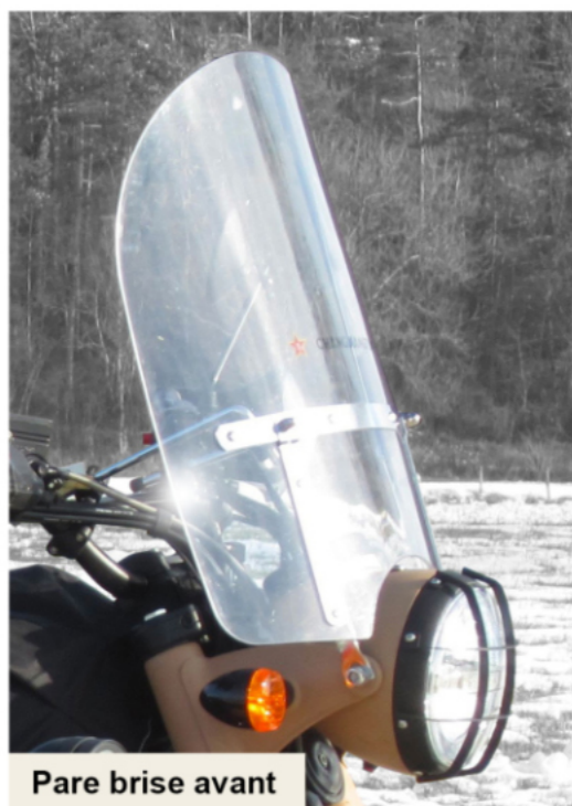
Pare brise avant