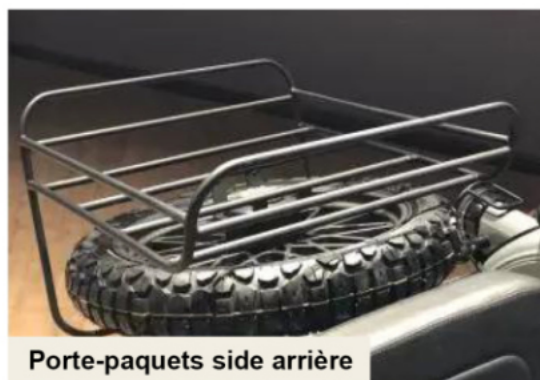
Porte-paquets side arrière