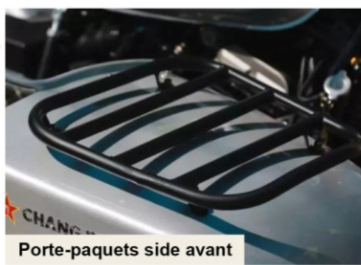
Porte-paquets side avant