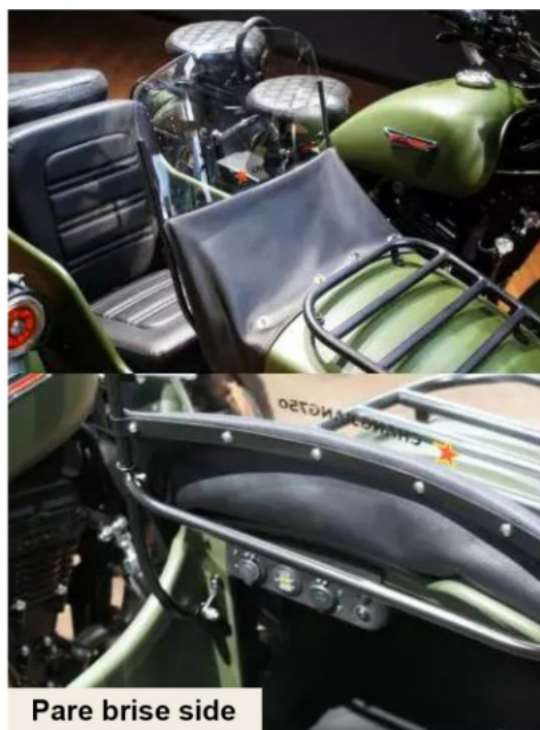
Pare brise side