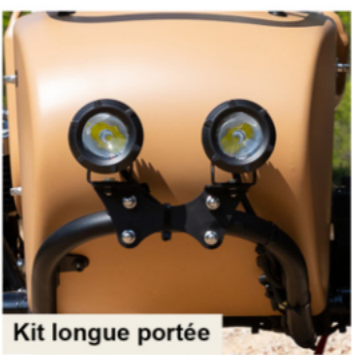
Kit longue portée